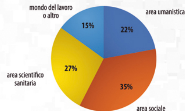
SCELTE POST LICEO DELLE SCIENZE UMANE 2022